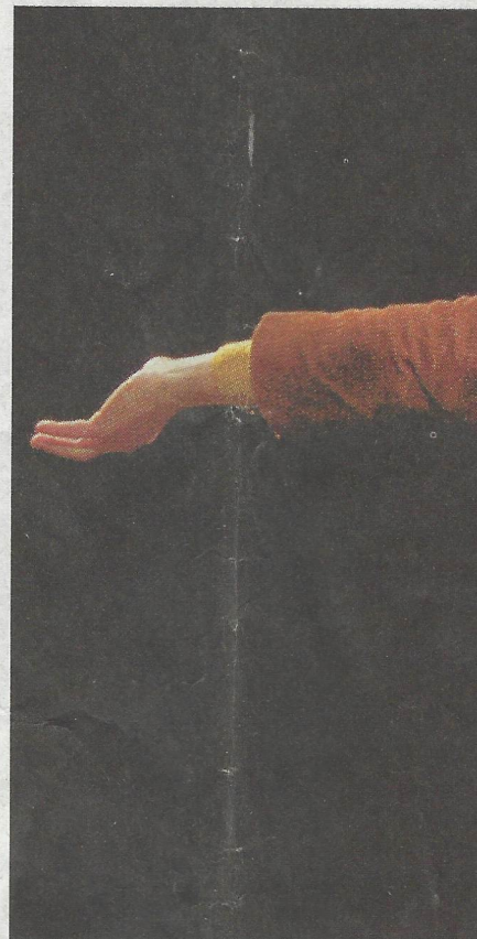
„Total Bock auf Remmi-Demmi“: Der „An

Aber Johann König war da – und wie. Auch ohne Info auf der Stadthallen-Homepage waren rund 350 Besucher in die Höxteraner Residenz gekommen. „Ich sag es Ihnen sofort, mir steht nur Cord“, begrüßte König die Zuschauer. König ist ein einzigartiger Anti-Komiker. Es gibt Komiker, die machen schlechte Gags, die bei den meisten Konsumenten so gerade noch als gut durchgehen. Johann König geht da mutig noch einen Schritt weiter. Er bringt schlechte Gags so gnadenlos gut, dass man ihm mit Fug und Recht den Titel des Königs